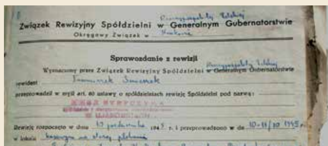
Fragment sprawozdania z rewizji przeprowadzonej przez Związek Rewizyjny Spółdzielni Rzeczypospolitej Polskiej-październik 1945r.

ku znajdowała się w stolicy gminy. Dlatego też w styczniu 1981 roku Bank Spółdzielczy z Ujanowic przeniósł się do nowego budynku w Laskowej, zaś w Ujanowicach utworzono Punkt Kasowy, który działał do końca roku 1992.