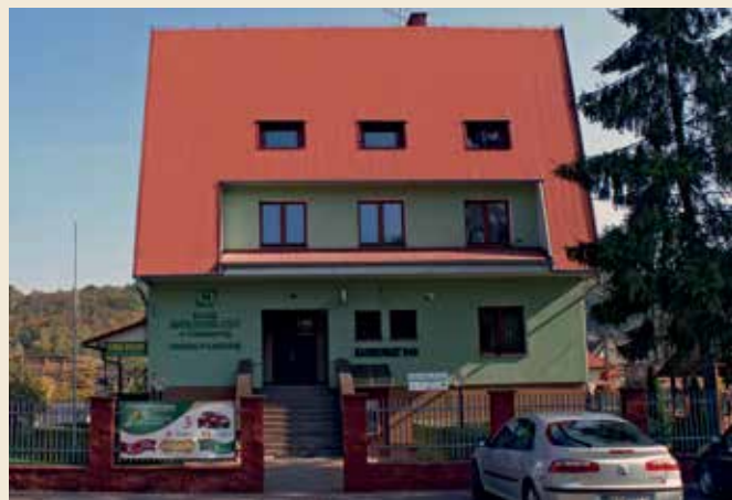
Budynek Oddziału w Laskowej zdjęcie z 2005r

W 1973 roku nastąpiła kolejna reforma podziału administracyjnego. „Ustawa z 29 listopada 1972 roku o utworzeniu gmin i zmianie ustawy o radach narodowych” z dniem 1 stycznia 1973 zlikwidowała gromady i ponownie wprowadziła gminę jako podstawową jednostkę podziału administracyjnego. Wtedy to powstała duża gmina Laskowa, w granicach której znalazł się także teren dotychczasowej gminy Ujanowice. Zmiany administracyjne spowodowały konieczność dostosowania statutu i terenu działania do nowego podziału administracyjnego. Z tego powodu Kasa Spółdzielcza w Ujanowicach zmieniła nazwę na Bank Spółdzielczy w Laskowej z dopiskiem: z siedzibą w Ujanowicach. Było to jednak rozwiązanie tymczasowe. Dążono do tego, by siedziba Ban-