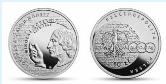
Moneta z wizerunkiem Mikołaja Kopernika

Każdy z nas wie, kim był Mikołaj Kopernik. Wybitny polski astronom, który „wstrzymał Słońce, ruszył Ziemię”. Przedstawił prawdziwą budowę Układu Słonecznego i swoją koncepcją wywołał największą rewolucję naukową od czasów starożytności. Nie wszyscy jednak wiedzą, że nasz wielki Polak, był nie tylko wybitnym astronomem, ale także ma znaczący dorobek w dziedzinie ekonomii. Był jednym z pierwszych zwolenników nowoczesnej polityki pieniężnej i autorem „Rozprawy o biciu monety”, w której udowodnił, że pieniądz gorszy wypiera lepszy.