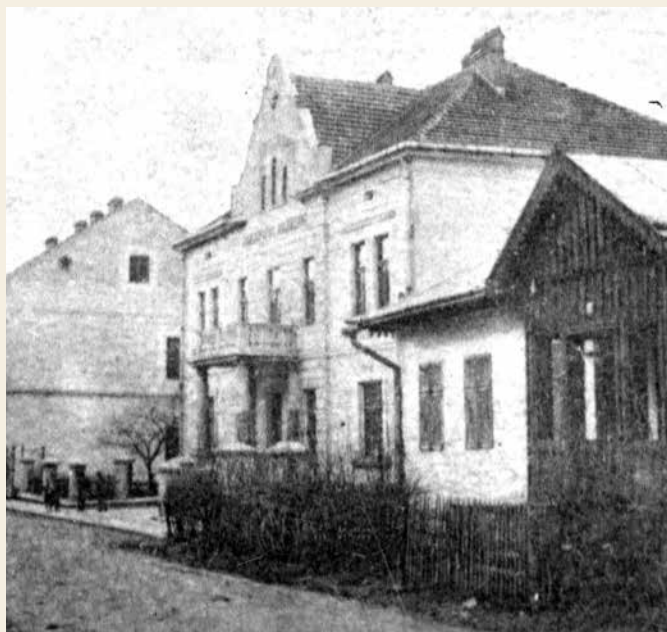
Pałacyk "Pod Pszczółką" – siedziba Towarzystwa Zaliczkowego

kach żydowskich, a przemysł prawie że nie istniał, natomiast lichwa rozwielała się na szeroką skalę. Wywłaszczenie z ziemi było na porządku dziennym tak dobrze w szeregach większej jako też i drobnej własności.