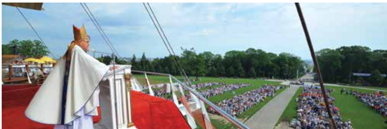
Zdjęcia: Krzysztof Świergot